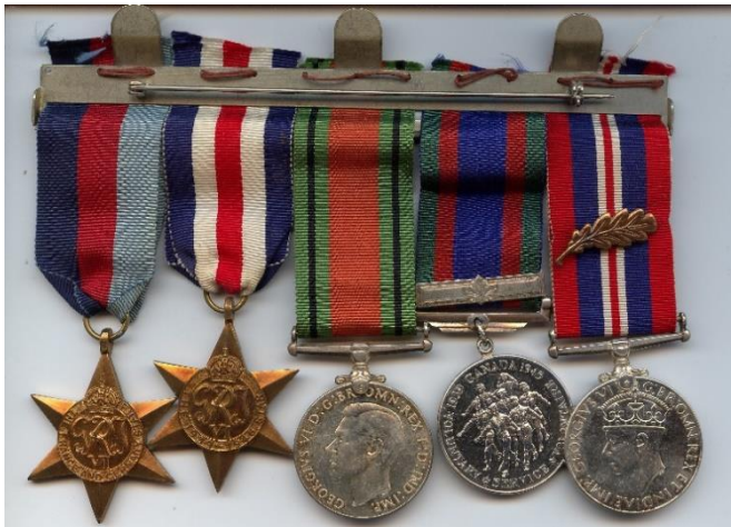
Onderscheiding The Oak Leaf (eikenblad) betekent een eervolle vermelding.

Op 23 juni 1943, terwijl hij in Shilo is, krijgt Frederick een eervolle vermelding. Helaas zijn hier geen bijzonderheden over bekend.